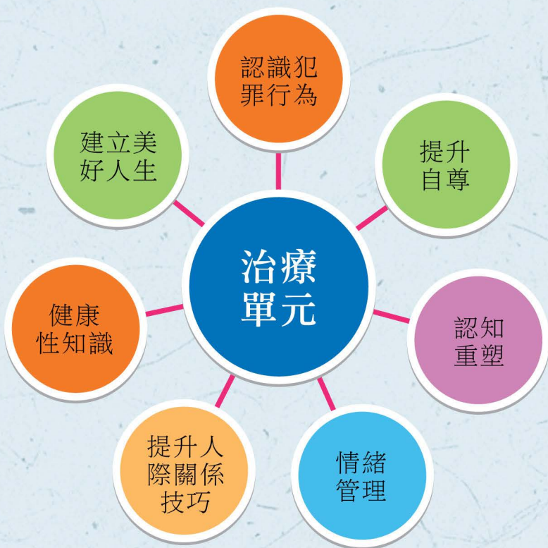
圖：治療計劃包括七個主要單元

治療計劃以小組治療為主，並輔以個人治療；同時，參加者需要完成一系列為干犯性罪行的在囚人士而設的治療手冊。治療計劃主要包括以下七個單元：