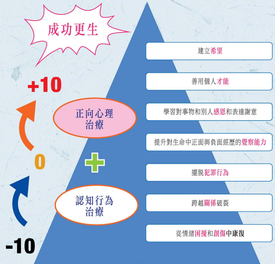
圖：治療計劃的詳細內容