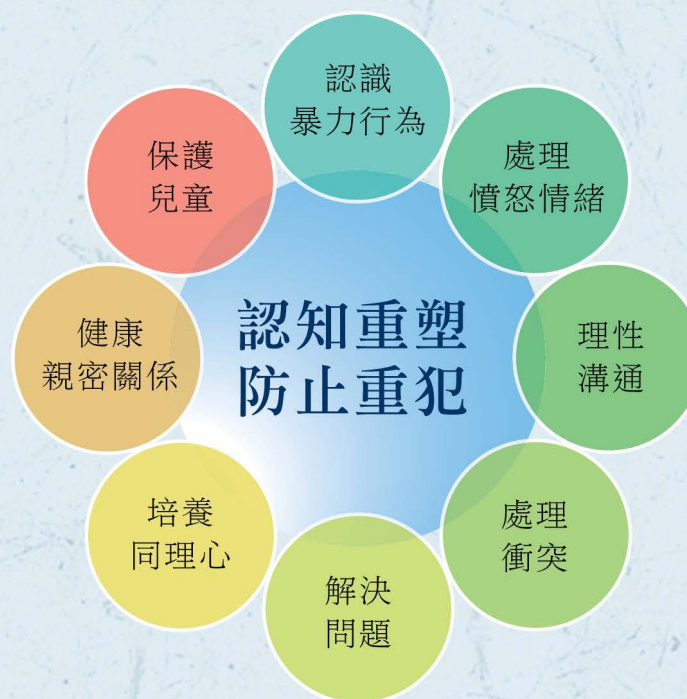
圖：治療計劃包括核心和選修單元

科學研究顯示，暴力行為是複雜而多樣，形式、嚴重程度和動機亦各有不同。干犯暴力罪行的在囚人士，通常有一些心理特質，令他們傾向用暴力解決問題。本署臨床心理學家參考了外國懲教機構的治療方針，並因應本地在囚人士的特質，設計了以心理學理論為基礎、科學實證為本的預防暴力心理治療計劃，共有十個單元：